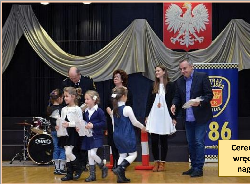
Ceremonia wręczenia nagród.